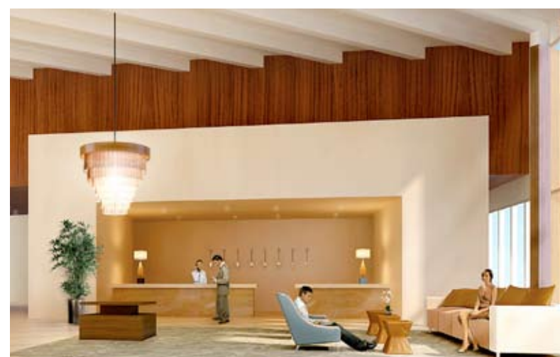
El hotel será operado por la prestigiosa firma Kimpton Hotels & Restaurants.