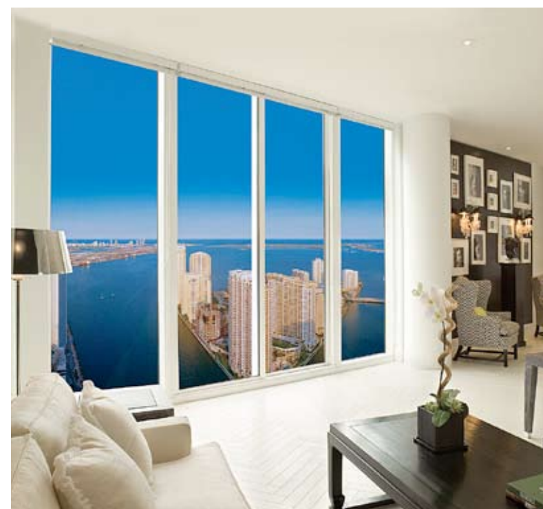
Amplios y confortables espacios distinguen a Epic.