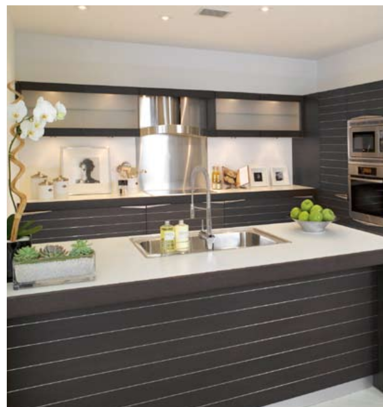
Las cocinas incluirán equipos de gran calidad.