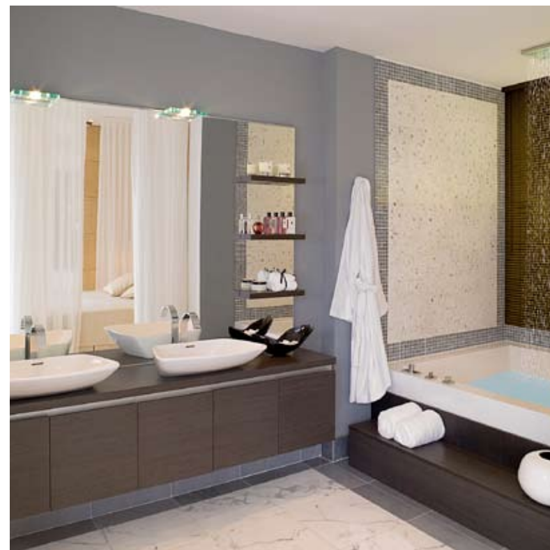
Los baños tendrán mármol de Calacatta.